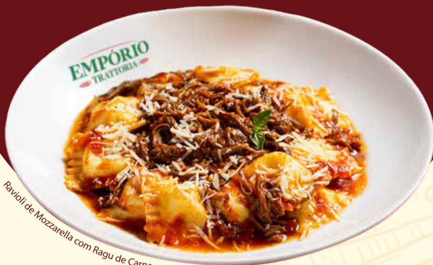
Ravioli de Mozzarella com Ragu de Carne