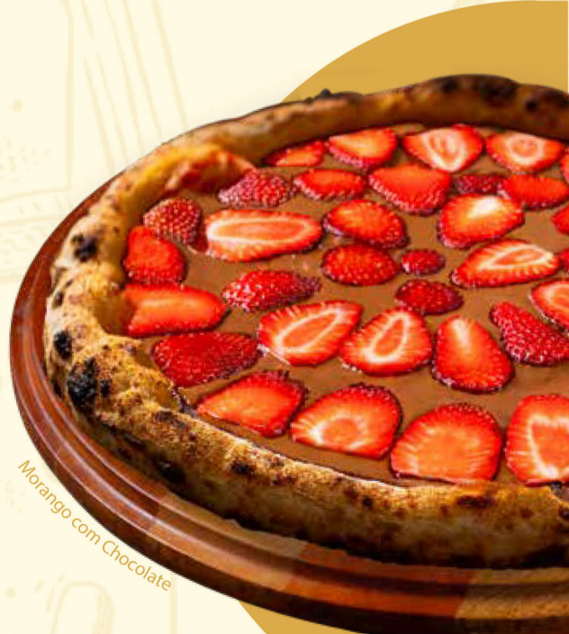
Morango com Chocolate