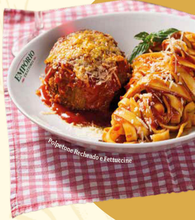
Polpetone Recheado e Fettuccine