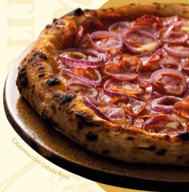
Calabresa com Cebola Roxa