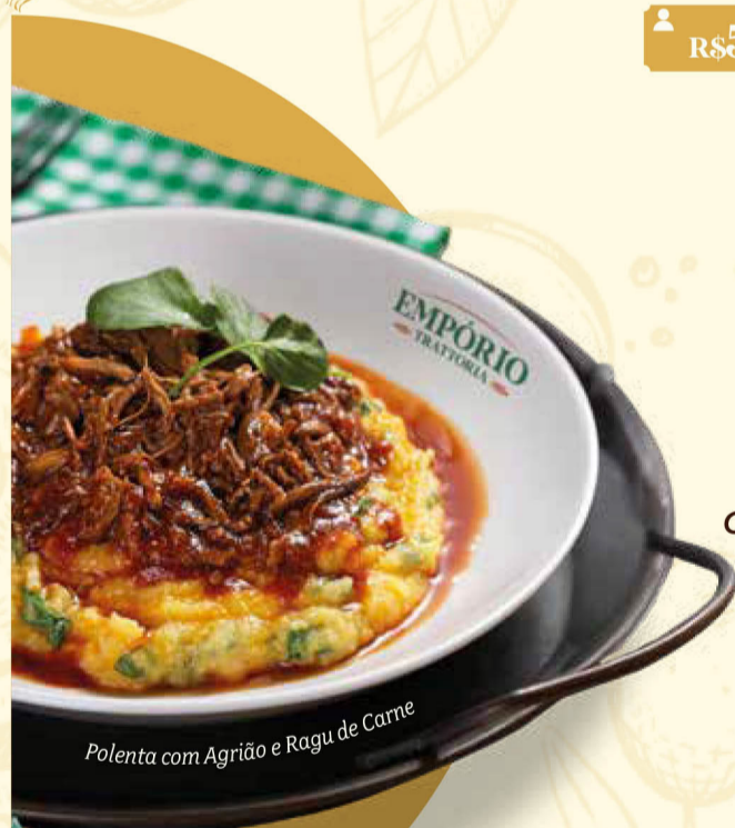
Polenta com Agrião e Ragu de Carne